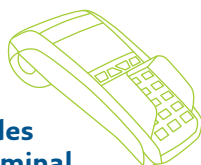
passendes REA Terminal für bargeldlose Zahlung